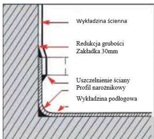
Rysunek 1. Układanie wykładzin na ściany w pomieszczeniach mokrych

Zaznaczenia na podłożu lub wykładzinie należy robić wyłącznie ołówkiem grafitowym, ponieważ długopis może pozostawiać ślady mogące przenikać przez wykładzinę.