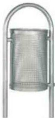
Rysunek 2. Przykładowa wizualizacja