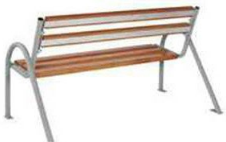
Rysunek 1. Przykładowa wizualizacja